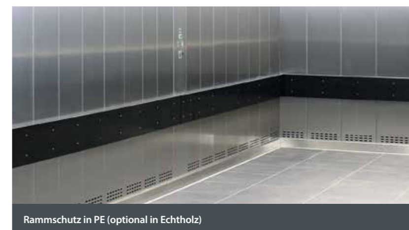
Rammschutz in PE (optional in Echtholz)